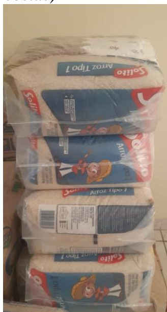
Doação Tropical Calçados ( 18 cestas)