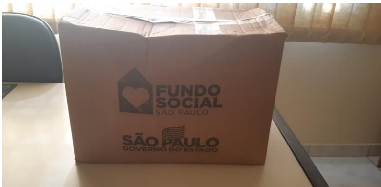
Doação Fundo Social (50 cestas)