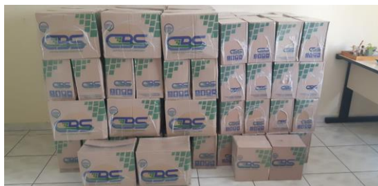
Doação Sicoob Cooperaso (50 cestas)